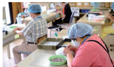
[地域活動支援センター]