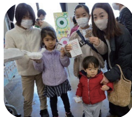
[地域での交流イベント]