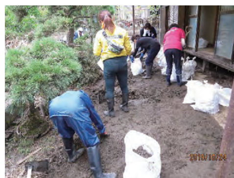
[被災地支援ボランティア]