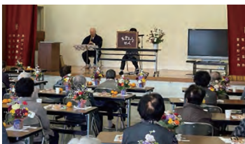
[ふれあい活動交流会]