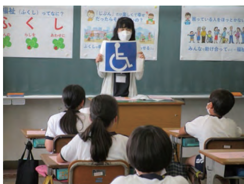
[小・中学生への福祉体験学習]