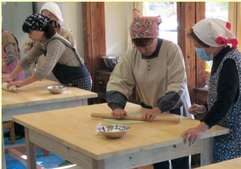
第6期わくわく大学「そば打ち体験」 H23.11.16