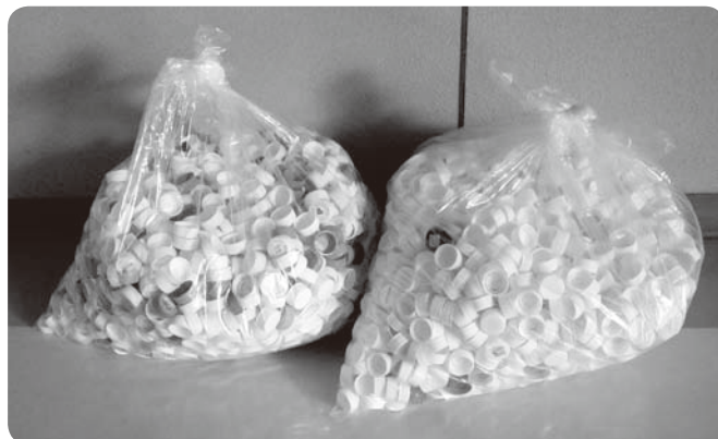
ペットボトルキャップ