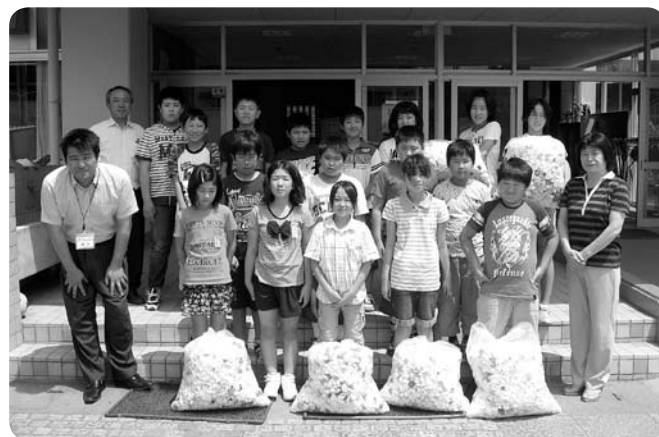
石岡市立小桜小学校の皆さん