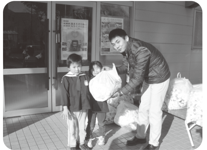
学校法人わかば学園八郷幼稚園 様