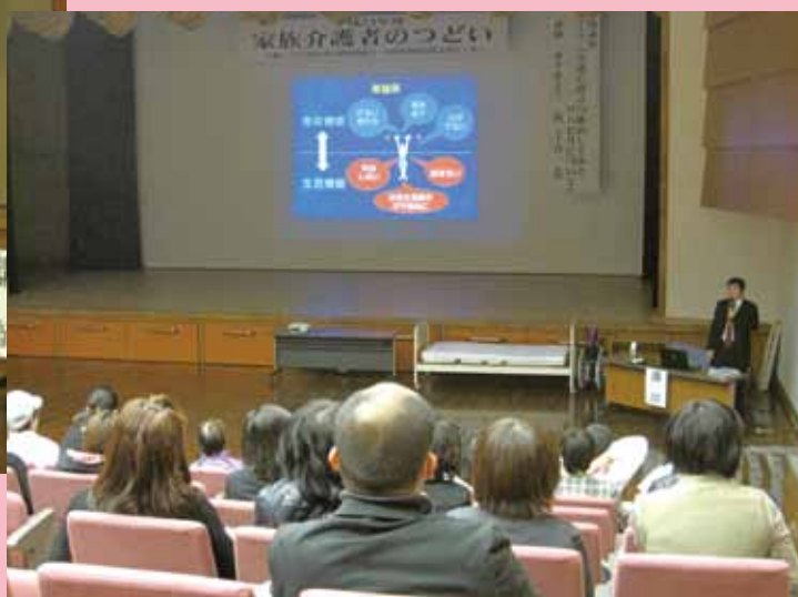
平成 24 年度家族介護者のつどい (H25.3.2 ひまわりの館)