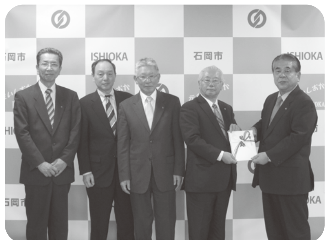
日本ナショナル製罐(株) 様