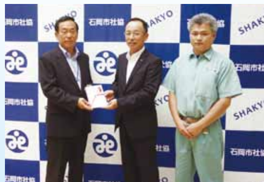
日本ナショナル製罐(株) 様

日本ナショナル製罐(株)様より 150,000円、 石岡市民謡舞踊連合会様より 74,100円を お預かりしました。 ありがとうございました。