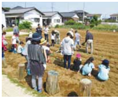
芋の苗植えイベントの様子

東之辻1部では、地域住民が三世交代交流イベント(芋の苗植え・夏祭り・町内花壇)を通して地域の絆を深めながら、いきいきクラブ・町内会・子ども会の三位一体で、定期的に防犯パトロールや、環境美化活動に取り組んでいます。