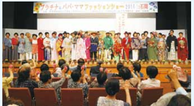
モデル全員が集合し、「上を向いて歩こう」を合唱しグランドフィナーレ！