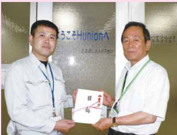
パナソニックエコソリューションズ労働組合 様