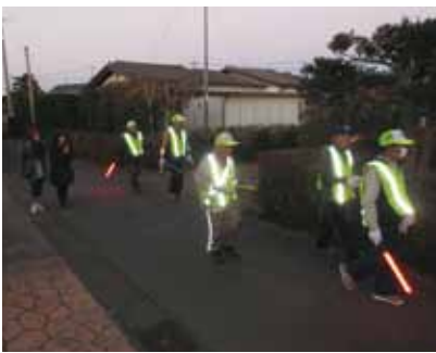
防犯パトロールの様子