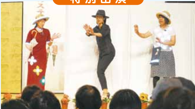
手作りの反射材を使った衣装を身につけ、観客に交通事故防止を呼び掛ける茨城県警察本部の職員