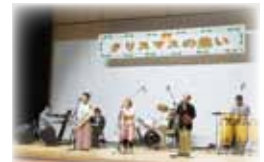
障害児・者福祉活動事業 (クリスマスの集い)