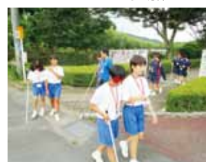
ガイドヘルプ体験の様子