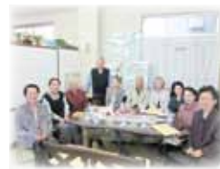
老人福祉活動事業 (いきいきミニサロン)

10月1日～12月31日 は赤い羽根共同募金運動期間です。 今年も皆様のご協力をお願いします。