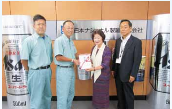
日本ナショナル製罐株式会社 様