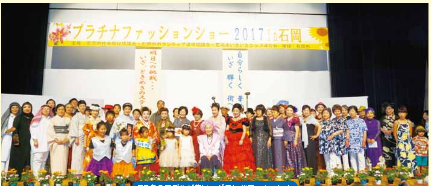
55名のモデルが集い グランドフィナーレ!