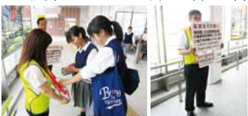
石岡駅での街頭募金の様子

7月18日（火）石岡駅において、石岡市ボランティア連絡協議会会員と、社協職員による福岡県・大分県豪雨災害義援金の街頭募金を行い、39,560円の義援金が寄せられました。お預かりした義援金は、茨城県共同募金会を通じ、被災地へ送られます。