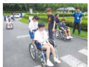
車いす体験の様子