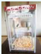
ポップコーン製造機