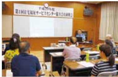
石岡警察署員による講話の様子