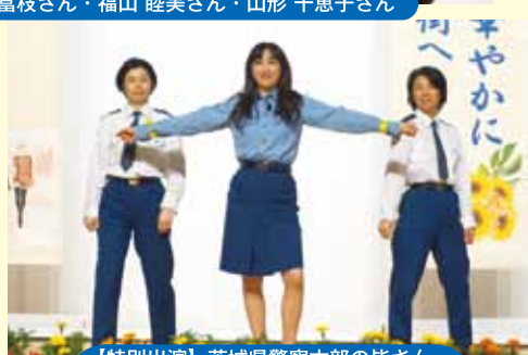
【特別出演】茨城県警察本部の皆さん。ブルゾンちえみwithBのネタを模して交通事故防止を楽しく呼び掛け★