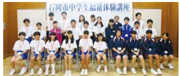
参加した中学生26名

8月3日（木）ふれあいの里石岡ひまわりの館において、「福祉体験講座」を開催し、市内の中学生26名が参加しました。講座内容は、老人ホーム等の見学、ボランティアに関する講話、車いすの操作体験や高齢者疑似体験を行い、高齢者・障がい者の気持ちを理解する貴重な体験をしました。