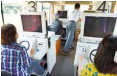
安全運転適性診断の様子