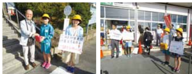
高浜小学校児童等による街頭募金の様子

○9月15日(土)から17日(月)の石岡祭礼の際、本部及び年番町等において義援金を募集し、総額94,903円が寄せられました。