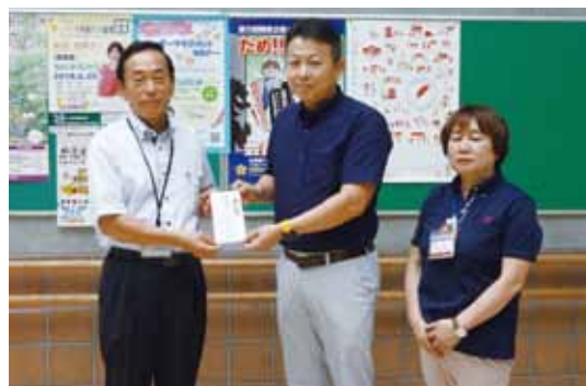
福) 愛の会ハートピア夏祭りin石岡 様