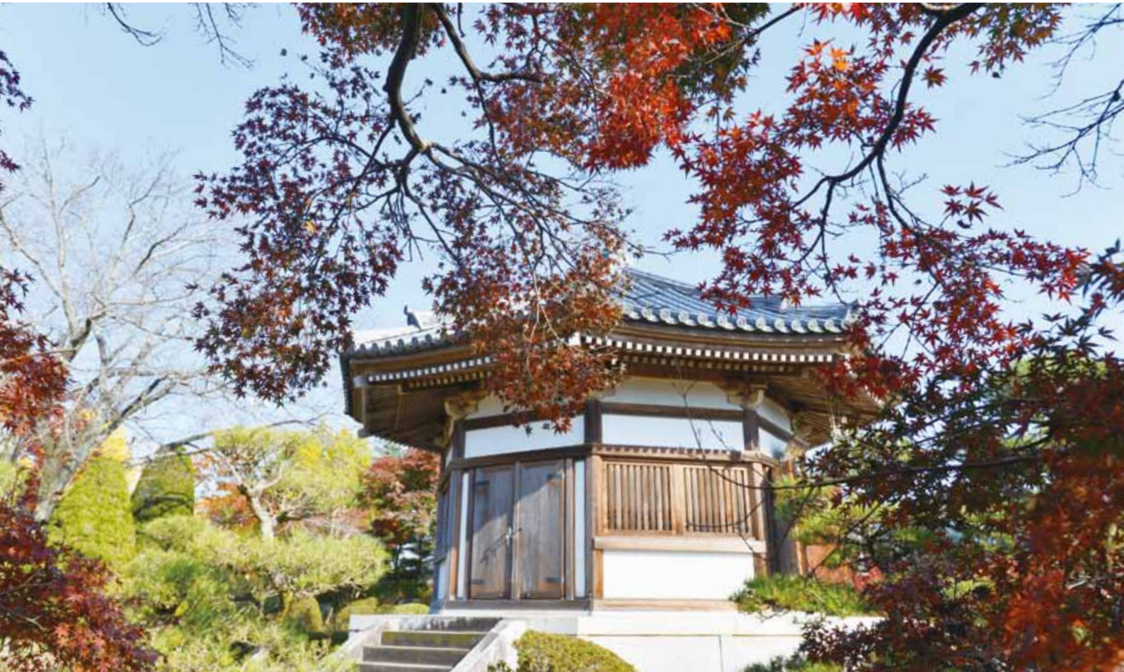
「雲照寺 弁財天堂（石岡市瓦谷）」