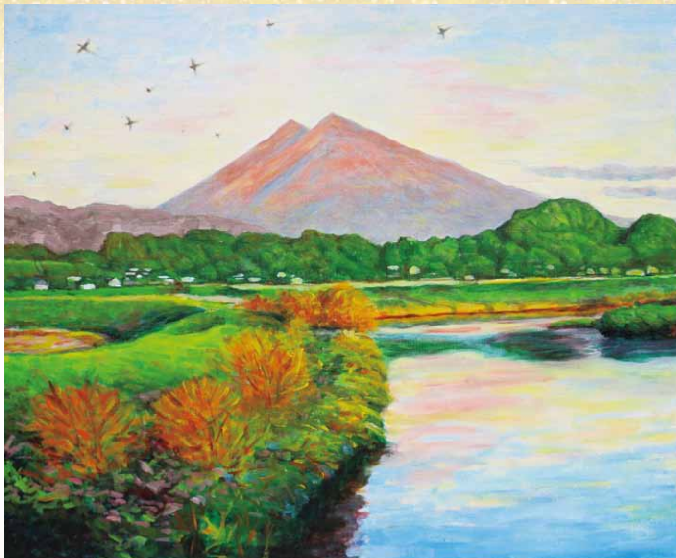
「赤 つくば」 作者：内田 義弘 様（石岡市東石岡）