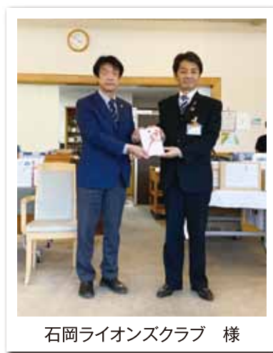
石岡ライオンズクラブ 様