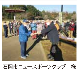
石岡市ニュースポーツクラブ 様