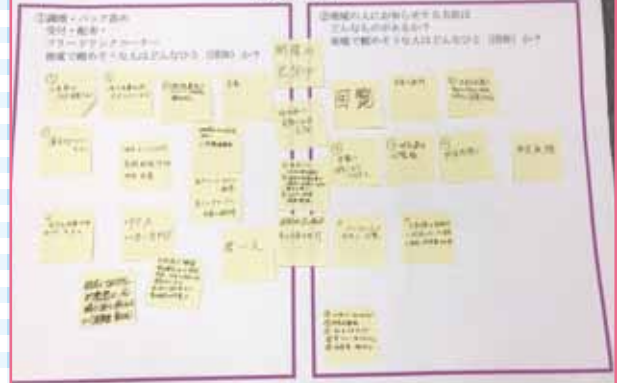
各自のアイデアを付箋に貼って情報共有