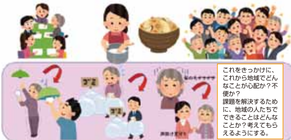
炊き込みご飯プロジェクトについて

地域のみなさんが話し合いアイデアを出し合う。 地域で協力してくれそうな人を見つけ。 (担い手さかし) 地域の人たちが会場に集まることで、顔の見える関係をつくる。