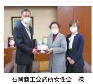
石岡商工会議所女性会 様