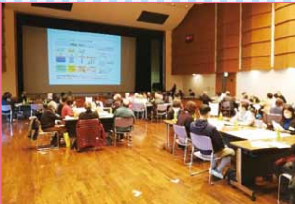
事業の仕組みについて説明

最後には、各圏域の協議体で、実施に向けた具体的なアイデアを出し合うなど活気ある話し合いがもたれました。