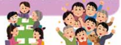
新しい名称について

石岡市では、今年度から生活支援体制整備事業の名称を「つながるプロジェクト石岡」に変更しました。市民の皆さんに親しみやすく、覚えやすい名称にすることで、地域づくりの推進につなげます。