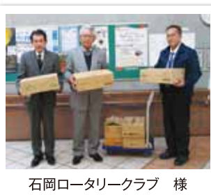
石岡ロータリークラブ 様