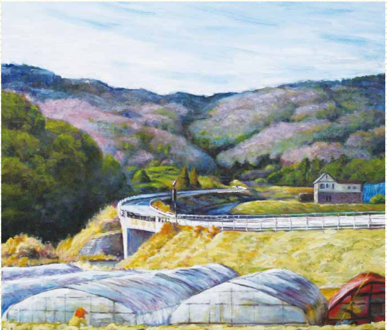
「朝日トンネルへ続く」 作者：内田 義弘 様（石岡市東石岡）