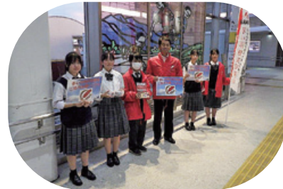
石岡駅での街頭募金の様子