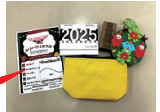
プレゼントの中身