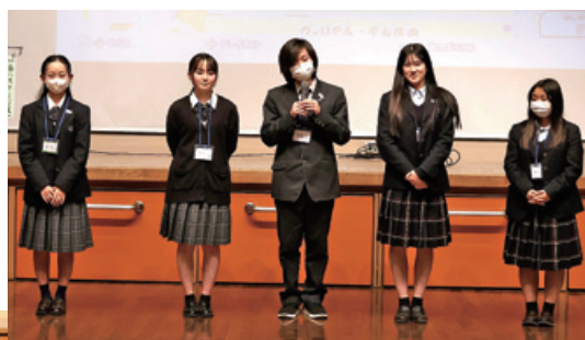
高校生ボランティアの皆さん

約2時間の体験はあっという間に終わり、帰り際には「次回もまた参加したい」という声がたくさん聞かれました。