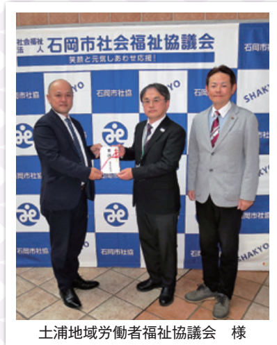
土浦地域労働者福祉協議会 様