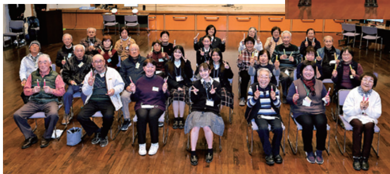
体験会を通じて大いに交流を深めることができました