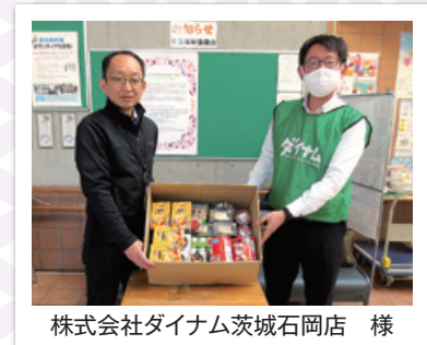
株式会社ダイナム茨城石岡店 様