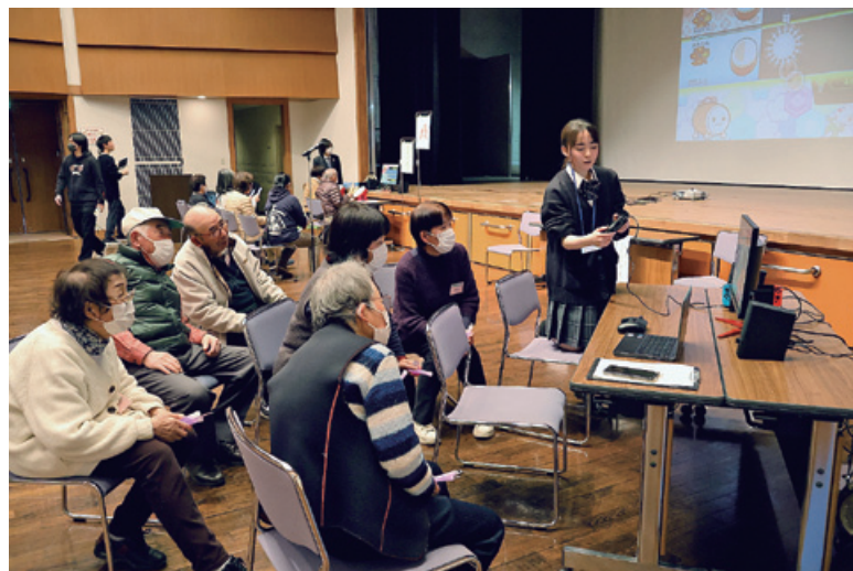
高校生ボランティアの説明に真剣に耳を傾けるプレーヤーの皆さん

eスポーツとは・・・ 「エレクトロニック・スポーツ」の略で、電子機器で対戦する競技、スポーツ全般のことです。最近では認知症予防や交流のツールとして、全国的に高齢者の健康や生きがいづくりに活用されたり、「シニアのスポーツの祭典茨城県健康福祉祭ねんりんスポーツ大会」の種目にも採用されています。