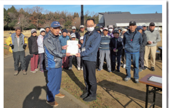
石岡市ニューススポーツクラブ 様 石岡市ターゲットバードゴルフクラブ 様